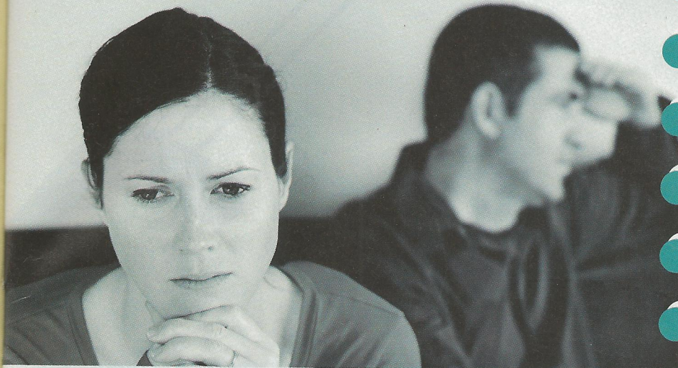
"מלחמות לא עוזרות. גם אחרי הגירושין צריך לגדל ילדים ביחד"